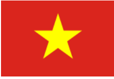
Tiếng Việt (Vietnamese)