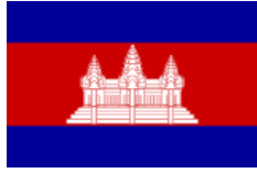
ភាសាខ្មែរ (Cambodian)